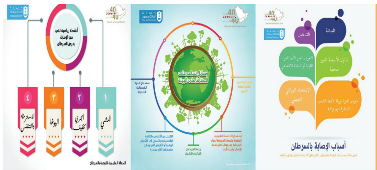
نماذج من مشاركة المدينة الجامعية

أطلقت المدينة الجامعية للطالبات سلسلة من الانفوجرافيك التوعوية عن مرض السرطان، أسبابه وطرق الوقاية منه بالإضافة إلى دور الغذاء الصحي وممارسة الرياضة والحفاظ على البيئة في مواجهة الإصابة بهذا المرض. وتأتي هذه المشاركة ضمن فعاليات الأسبوع الخليجي للتوعية بـ السرطان في نسخته الأولى التي تدشن في إطار الحملة الخليجية الموحدة للتوعية بالسرطان تحت شعار "40% حماية 40% شفاء" بهدف توحيد الرسائل الإعلامية في منظومة دول مجلس التعاون الخليجي. واعتمدت دول المجلس الأسبوع الأول من فبراير/شباط كل عام أسبوعاً خليجياً للتوعية بالسرطان تماشياً مع الاحتفال باليوم العالمي للسرطان، وذلك تحت رعاية الاتحاد الخليجي لمكافحة السرطان بالتعاون مع المركز الخليجي لمكافحة السرطان. يمكن الإطلاع على تفاصيل مشاركة الجامعة عبر وسم #الحملة_الخليجية_للتوعية_بالسرطان