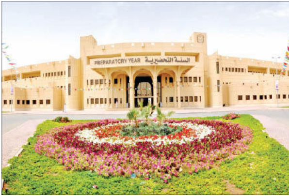
عمادة السنة التحضيرية