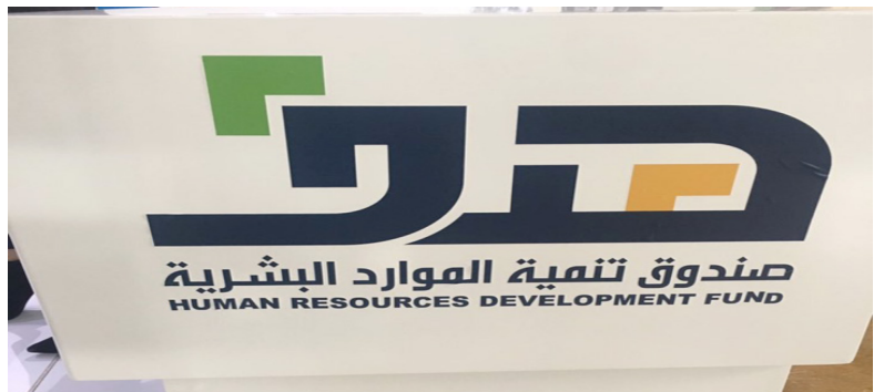
بعض المشاركين في المعرض