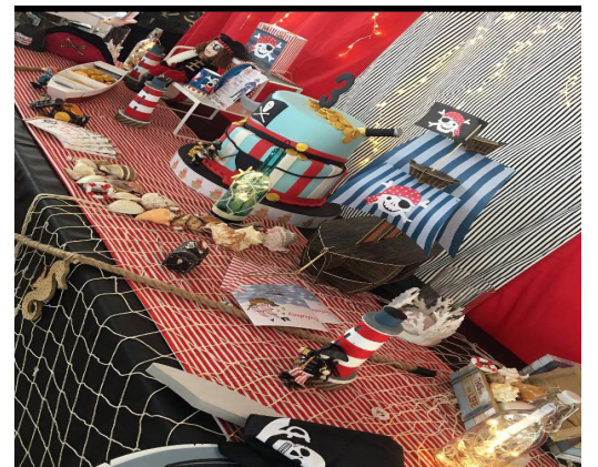
بعض من مشاركات الطالبات